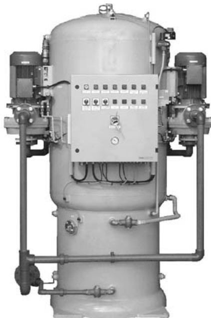
Fig. 3 TDV