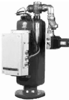
Fig. 2 GLA