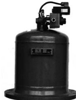
Fig. 4 GHE - SHE

Während der Inbetriebnahme stehen dabei den in Betrieb befindlichen Hebern und ggf. Kreiselpumpen die volle Leistung der Vakuumpumpe (AP) zur Verfügung. Neben einer zusätzlichen Vakuumpumpe (AP) werden die Gasableiter hierfür mit einer zweiten Armaturengruppe ausgeführt. Zur Unterbrechung der Heberwirkung können die Gasableiter auf Wunsch mit handbetätigten oder gesteuerten Belüftungsarmaturen bzw. separaten Vakuumbrechern ausgerüstet werden.