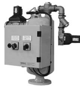
Fig. 4 GHE - SHE

Während der Inbetriebnahme stehen dabei den in Betrieb befindlichen Hebern und ggf. Kreiselpumpen die volle Leistung der Vakuumpumpe zur Verfügung. Neben einer zusätzlichen Vakuumpumpe (AP) werden die Gasableiter hierfür mit einer zweiten Armaturengruppe ausgeführt. Zur Unterbrechung der Heberwirkung können die Gasableiter auf Wunsch mit handbetätigten oder gesteuerten Belüftungsarmaturen bzw. separaten Vakuumbrechern ausgerüstet werden.